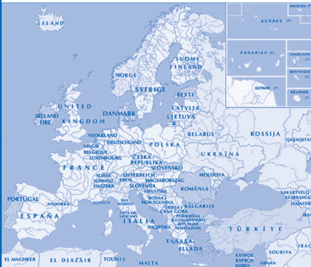
Европска унија данас (25 држава-чланица)